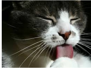
...Une langue de chat