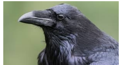
.....un bec de corbin