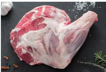
.....une épaule de mouton