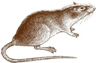
.....une queue de rat